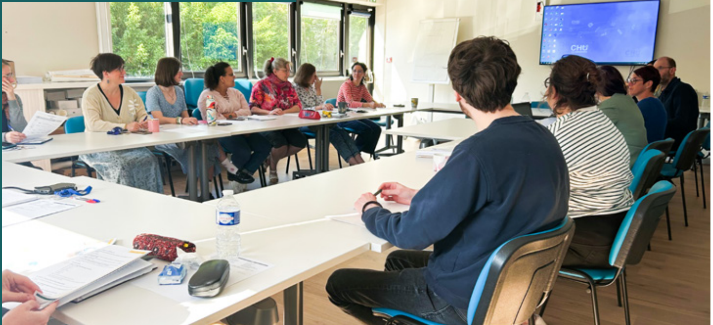
— La salle de formation du CRA