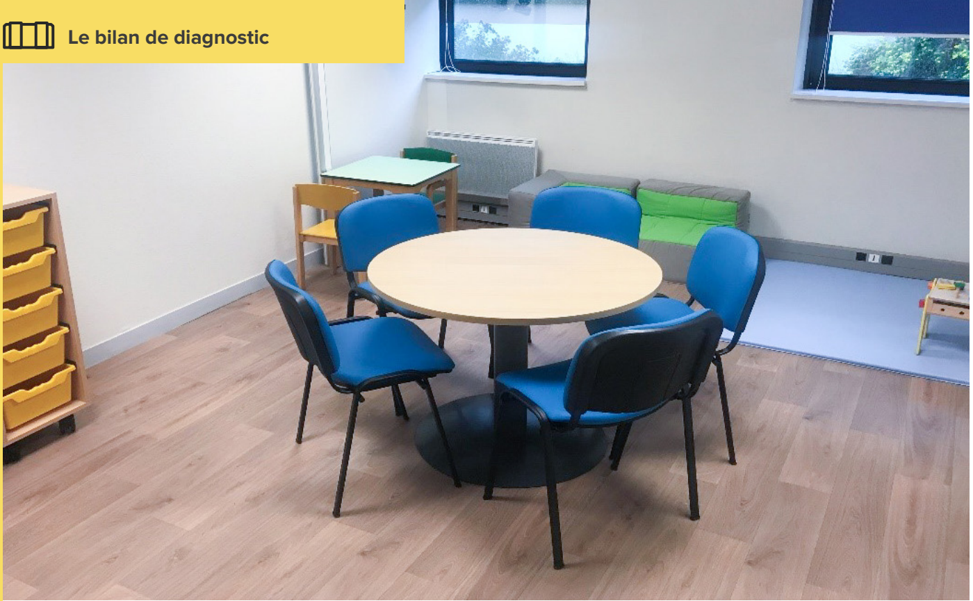
— Une salle de consultation au CRA